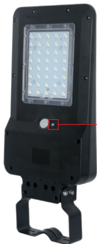
Bouton de contrôle ON / OFF